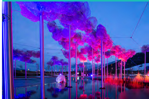
Swarovski Kristallwelten in Wattens bei Innsbruck